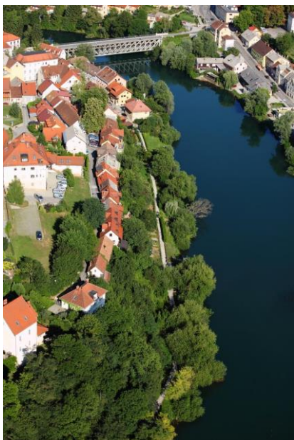
Slika 1: Breg