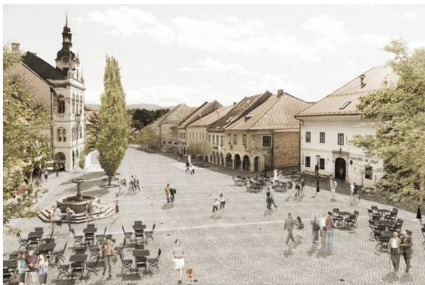
Slika 2: Glavni trg