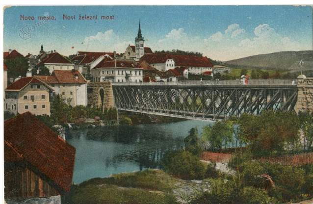
Slika 3: Kandijski most